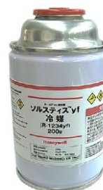
ソルスティス™yf 1234yf冷媒 200g