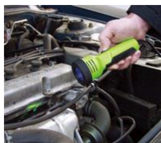
1234yfも蛍光剤と紫外線ランプでCheck

※1234yfやEV・HVの電動コンプレッサーについて、冷凍機油や口金のサイズにより、蛍光剤を使い分ける必要があります。不明の場合、お気軽にお問い合わせください。